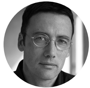
Design: Justus Kolberg

KLASSISCHES DESIGN, NEU INTERPRETIERT. Überzeugend durch seine klare Linienführung und reduzierte Formensprache. Sitzfläche, Gestell und Rückenlehne zeigen sich proportional ausgewogen und laden zum entspannten, auch längerfristigen Sitzen ein. Freischwinger, 4-Fuß oder 4-Fuß mit Rollen. Universell einsetzbar im Arbeitsplatzbereich, Meeting, Seminarräumen oder Cafeterias.