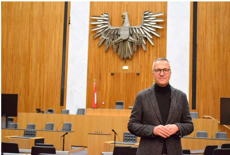
Parlamentssprecher Karl-Heinz Grundböck vor Kulisse des Sitzungssaals

Auch im Nationalratssitzungssaal des österreichischen Parlaments ist Holz das Material der Wahl. Während die historische Einrichtung aufwendig restauriert wurde, erhielten die Büroräume eine neue Ausstattung aus Möbeln der Firma Bene mit dem PEFC Siegel.